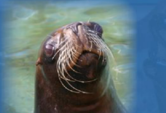
Южный морской лев