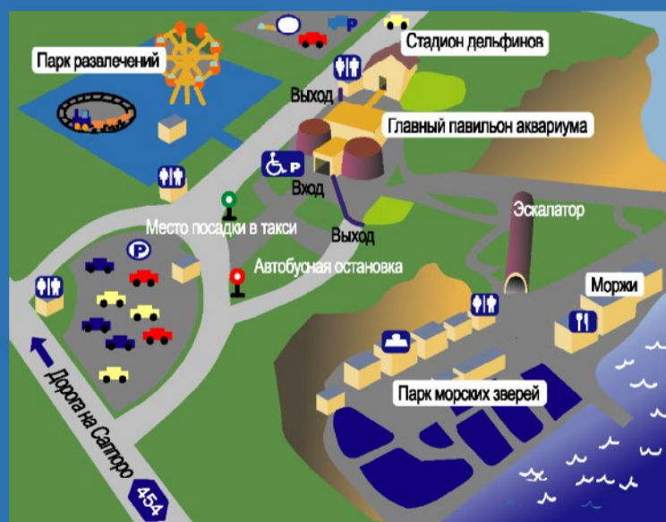
Общая карта "Аквариума Отару"

1 катание 100 иен абонемент на 11 катаний 1000 иен