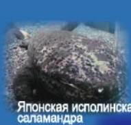
Японская исполинская саламандра

Диковинные морские обитатели представлены в небольших аквариумах